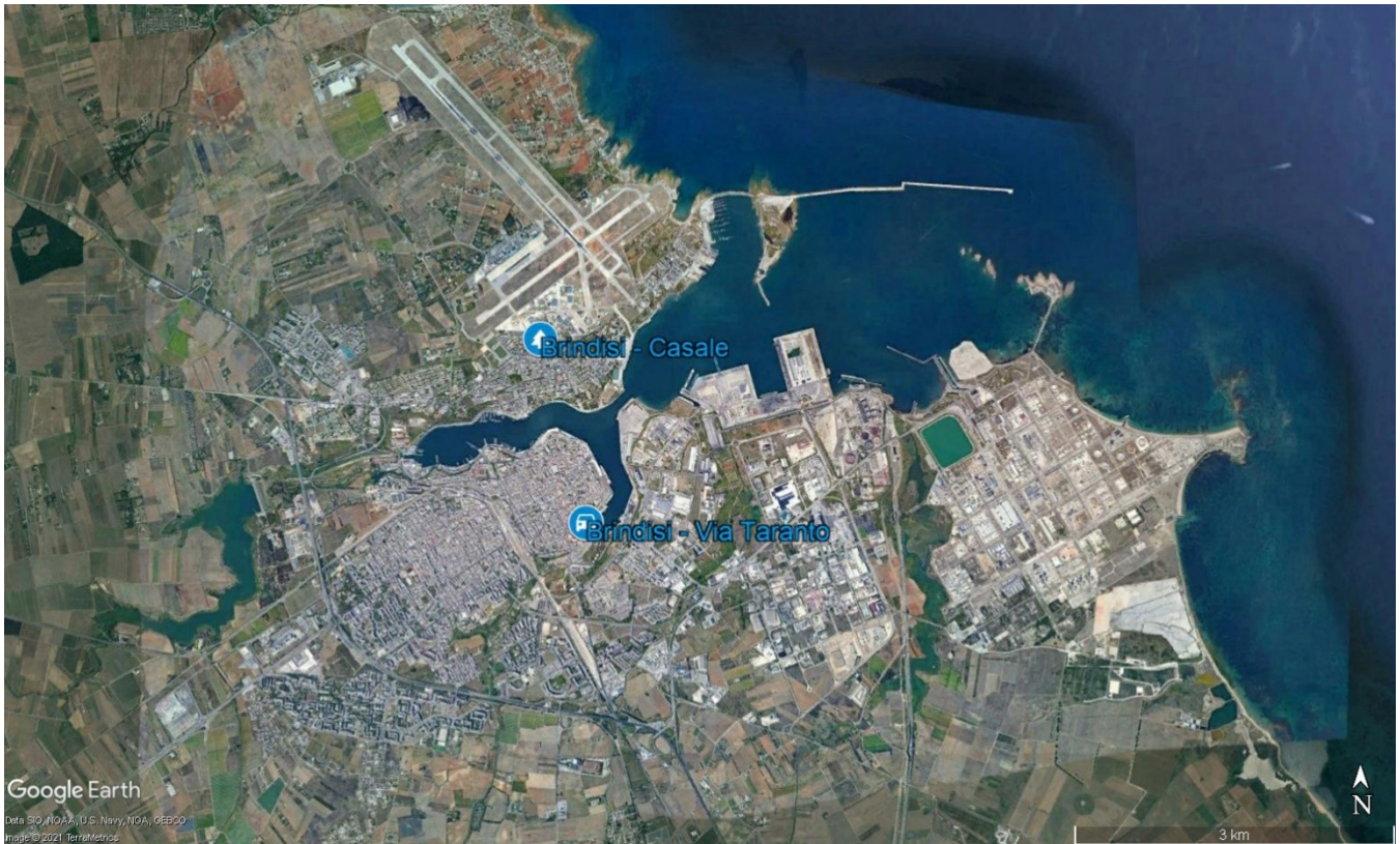
Figura 2: Localizzazione dei siti di misura rispetto al territorio comunale di Brindisi.

Nello specifico, il sito di Brindisi - Casale è oggetto di analisi dei filtri in considerazione di quanto stabilito nella convenzione tra Arpa e A2A, ex Edipower, sottoscritta il 22/04/2008, recepita con Del. DG n. 357 del 22/04/2008, scaduta e rinnovata con nuova convenzione il 28/11/2013, recepita con Del. DG n. 640 del 06/12/2013, scaduta nel dicembre 2016 e non più rinnovata per la fermata definitiva della centrale termoelettrica.