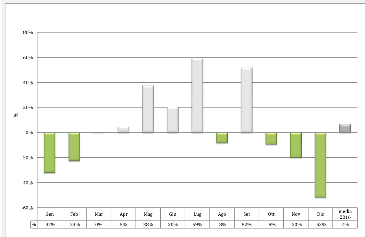
Indice dell'intensità pluviometrica giornaliera ("Simple daily intensity" index)

Fonte: Elaborazione ARPA su dati provenienti dalla Struttura di Monitoraggio Meteoclimatico - Centro funzionale del Servizio Protezione Civile